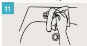
Utilice la toalla para cerrar el grifo.