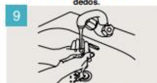
Enjuáguese las manos.