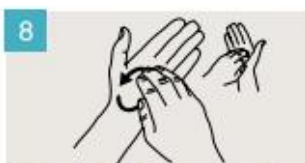
Frótese la punta de los dedos de la mano derecha contra la palma de la mano izquierda, haciendo un movimiento de rotación, y viceversa.