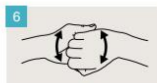
Frótese el dorso de los dedos de una mano contra la palma de la mano opuesta, manteniendo unidos los dedos.