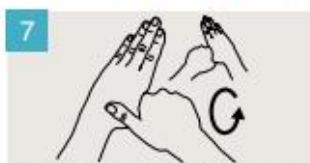
Rodeando el pulgar izquierdo con la palma de la mano derecha, fróteselo con un movimiento de rotación, y viceversa.