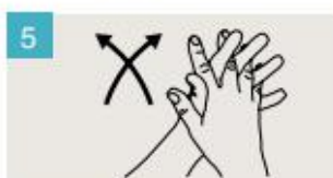
Frótese las palmas de las manos entre sí, con los dedos entrelazados.