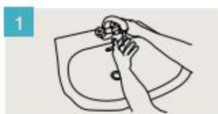
Mójese las manos.

DURACIÓN DEL LAVADO: entre 40/60 segundos