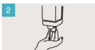
Aplique suficiente jabón para cubrir todas las superficies de las manos.